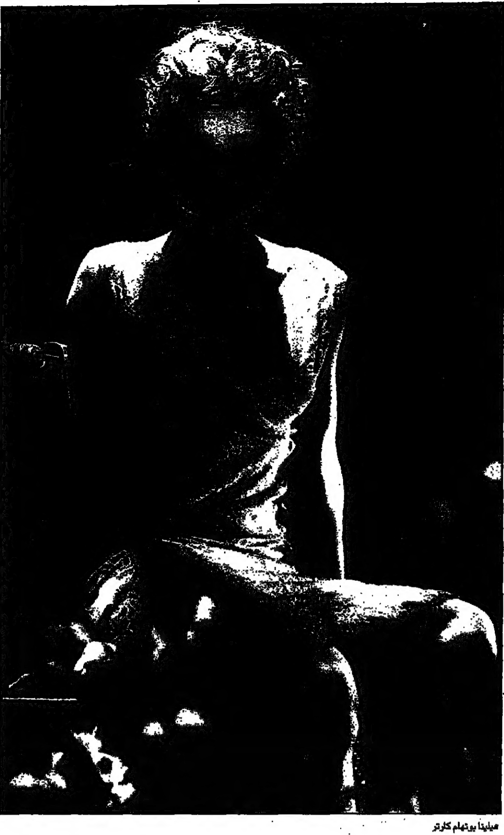
هيلينا بونهام كارتر

لعمل هوليوود في كير حانيا، ولكنني لا أري أن كنت متأسية له، لكن فيلم وودي آلن أثبت أنني أستطيع تمثيل الأطفال الأمريكية، أنت من تعلم». بعد أن كانت هيلينا ممثلة الصحافة بعد فيلمها «طبيدي جيه»، فإن التقاليد الانكليزية في صنع النجوم تم تحطيمها مرت عليها هي أيضا، فخلال العقد الأخير تحولت العناوين من اللامعة والناطقة لهيلينا إلى الهجوم عليها، هيلينا لم تعد ملاحقة من رجال بطاردها، هيلينا لم تعد التواجد للفتاة عند شركة تسجيل بارلي، هيلينا تمسح ما بدأ به من كينيث براوانه العناوين تيدات ولكن التقاليد ما زالت هي نفسها، جدا الأكبر كان رئيس الوزراء الليبرالي هيريت اسكويت، أنها صار لديها وكيل أعمال وهي بامر 13 عاما واجته في دليل الهاتف، وأنها رغم أنها بامر 30 حاليا فإنها ما زالت تعيش مع نها وأبيها». في الشهر الماضي نشرت إحدى الصحف عنها قولها أنه من الأسهل أحيانا الحصول على عمل في مجال التمثيل إذا لم تكن جميلا أو من الطبقة العليا في المجتمع. وقد ردت الممثلة كاتي بيورن أن هيلينا بونهام كارتر تحكي بذلك أن كل النساء من الطبقة العاملة هن بشعنا». تقول هيلينا بلطف كان ما قلته غيبا بالمعنى لكنني كنت أقصد به أن يكون ساخرها، وتعلق على الصحافيين: «واحد من الصحافيين نشر مرة أن لدي مؤخرة ضخمة جدا، ومن الذي يقول ذلك سوى رجل ماغنون، لو وقعت يدي عليه لعلمتة درسا، واحد آخر قال إن ليس لدي رقيقة وصفاي آخر سألني أن كنت أعاني من مرض الأوروكسياء وقتت له على حد علمي أنني لا أتقها عادة ولكن مع ملاحظات وأسئلة كهذه فليس من الغريب أن أعل».